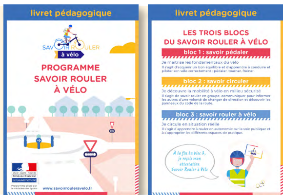
Livret pédagogique du SRAV – Ministère des Sports

Plusieurs pistes apparaissent nécessaires pour amplifier l'apprentissage du vélo auprès des jeunes. Un enjeu fondamental lorsque l'on observe la baisse de la pratique des vélos chez les moins de 18 ans conduisant à une augmentation inquiétante de la sédentarité. Pour les élu-es du club, plusieurs pistes sont à explorer.